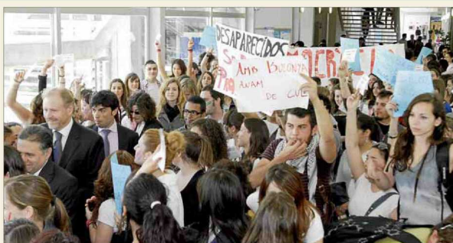
Estudiantes de la UIB aprovecharon el acto de ayer para reclamar mejoras organizativas en sus estudios.