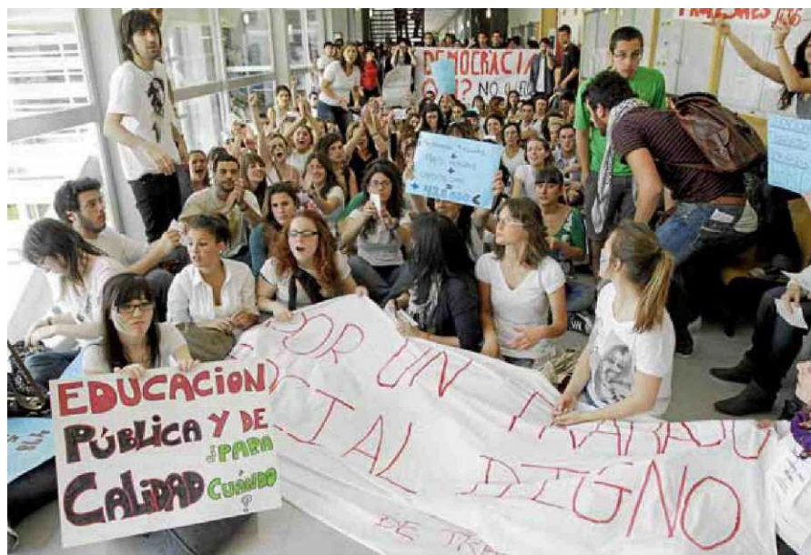
Més d'una seixapartntena d'alumnes prengueren part en les protestes contra Bolonya i per Treball Social.