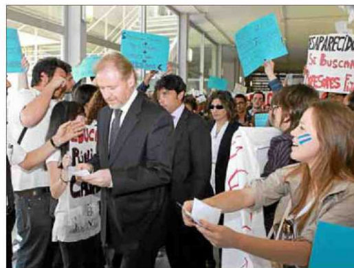
El delegado del Gobierno entre alumnos protestando por la falta de recursos.