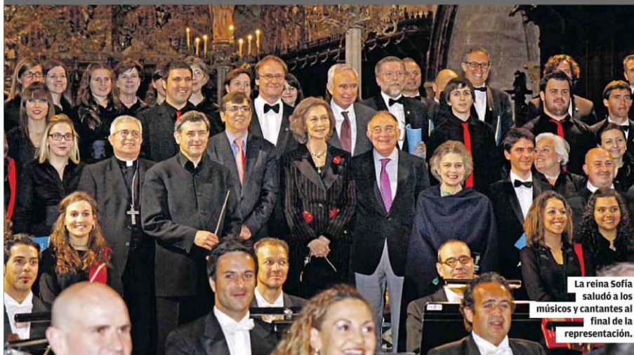
La reina Sofía acude al recital sobre la obra de Mozart, en beneficio del Proyecto Hombre Ⓢ 49

La reina Sofía saludó a los músicos y cantantes al final de la representación.