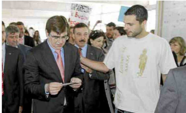
Un alumne de Treball Social dóna un fullet al president Antich.