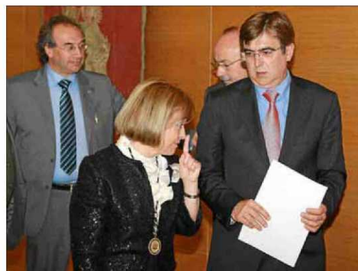
La rectora con el president Antich. Les siguen Martí March y Tomeu Llinàs.

Por su parte, Antich ensalzó en su discurso el papel de la universidad y lamentó el poco presupuesto motivado por la crisis. Apeló a la imaginación y la capacidad de gestión para aprovechar los recursos al máximo. «Es cuestión de prioridades», subrayó, informa Efe.