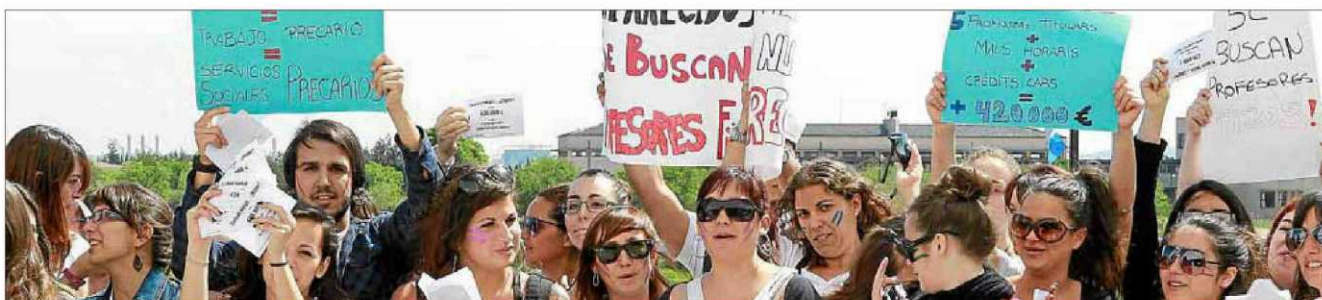
Estudiantes del Grado de Trabajo Social de la UIB protestando ayer en la puerta del edificio Jovellanos, donde se celebró el acto de toma de posesión de la rectora.