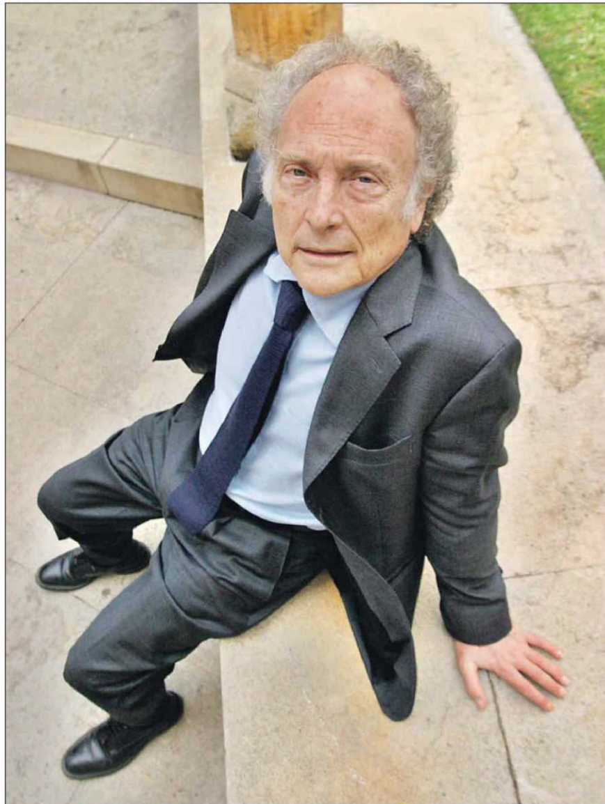
Eduard Punset s'ha mostrat il·lusionat amb el nomenament.