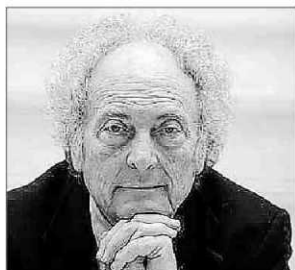
La UIB nomenarà Eduard Punset doctor honoris causa.

Moltes de vegades, en sentir parlar un científic, costa que el públic general, no entès en la matèria, pugui copsar l'objecte i els resultats de les seves investigacions. La tasca de biòlegs, metges, químics... repercuteix en el benestar de tota la societat. El gruix de la població, però, desconeix de quina manera funciona, posem per cas, aquell