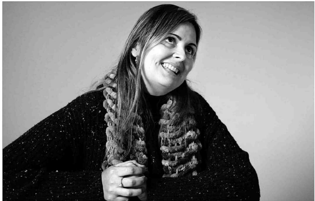
"Intentar regular las cuestiones relacionadas con la fe siempre trae malentendidos y enemigos". B. RAMÓN

«Aquí hay pocos problemas de simbología religiosa en los colegios, prima el sentido común» «Si un farmacéutico hace objeción de conciencia, se hacen turnos para que haya otro que sí venda» «El Papa tiene todo el derecho a opinar sobre normas que atentan contra una de sus doctrinas»