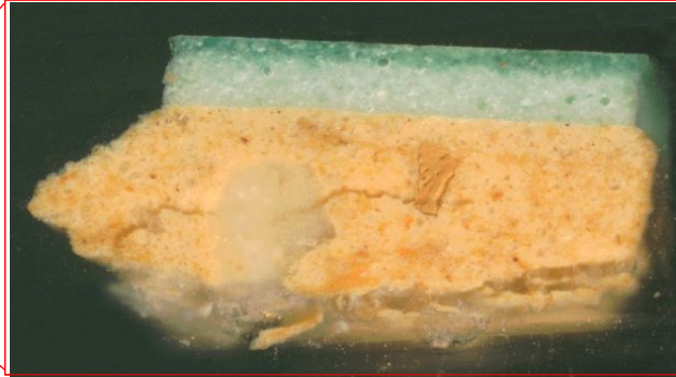
Estratigrafia (dreta) corresponent al cos ceràmic i a l'esmalt verd de la rajola (esq.) del paviment de l'església de la Cartoixa.

A més de l'estudi, l'equip de la UIB ha reconstruït virtualment el paviment deteriorat de l'església de la Cartoixa, la qual cosa ha permès completar la lectura simbòlica del paviment en el context del temple. La reconstrucció virtual s'ha fet mitjançant tècniques digitals de caràcter planimètric i tridimensional –com l'ús de la tècnica de l'escanejat per làser i dels programes informàtics associats–, amb la finalitat de recuperar el significat del paviment en el context arquitectònic del recinte sacre. La reconstrucció virtual ha permès a l'equip de la Universitat analitzar el paviment no com un simple element decoratiu, sinó com el punt de partida d'un itinerari iconogràfic de gran significat en el conjunt de l'església.