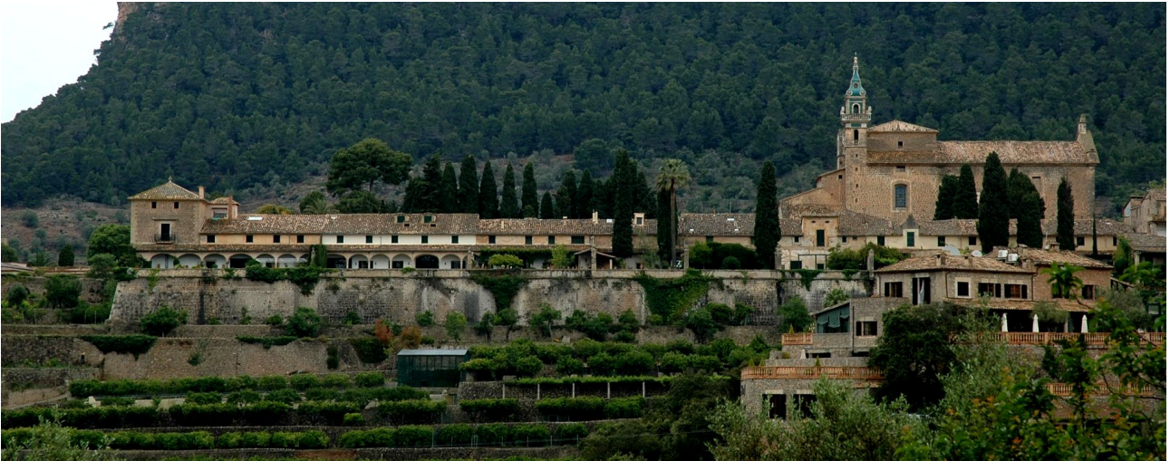
Vista actual del conjunt monumental de la Cartoixa de Valldemossa.