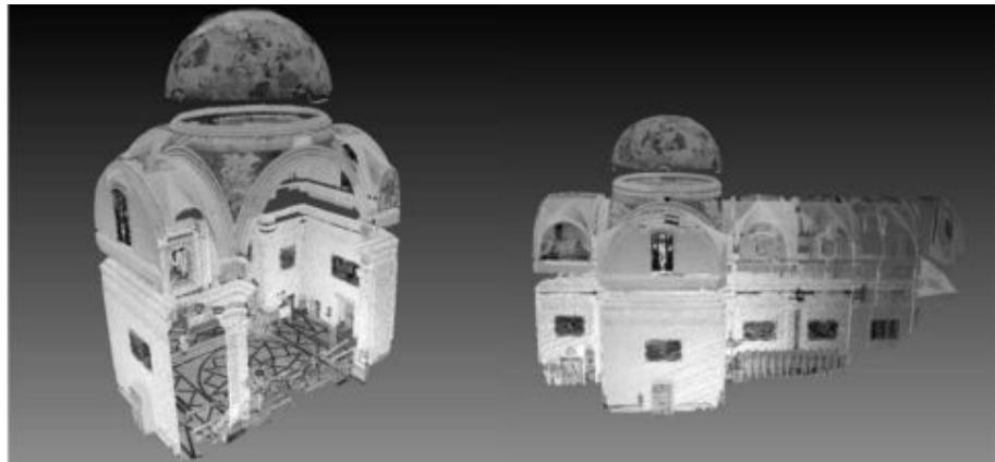
Reconstrucció virtual en tres dimensions de l'església de la Cartoixa.

La diversitat cronològica i l'extensió del conjunt monumental fan que el manteniment del conjunt monumental sigui complicat. Així, l'estat de conservació és desigual, i les problemàtiques que el grup de recerca de la UIB hi ha detectat es poden imputar a causes