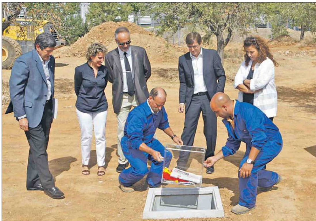
Las autoridades colocan la primera piedra de lo que será el complejo de investigación.