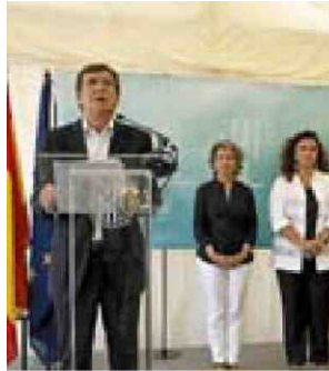
Antich ayer en el Parc Bit.