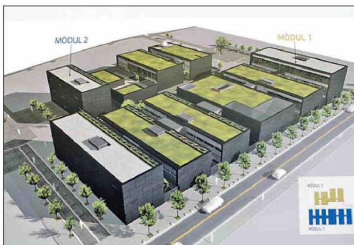
Maqueta del futuro centro ubicado en el Parc Bit.