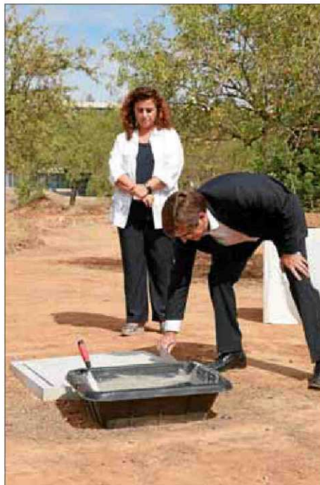
Antich ayer colocando la primera piedra.

El centro, cofinanciado por el Govern y la Unión Europea a partes iguales, dará cabida, concretamente en su módulo 2, a las actividades de varios institutos y grupos de investigación