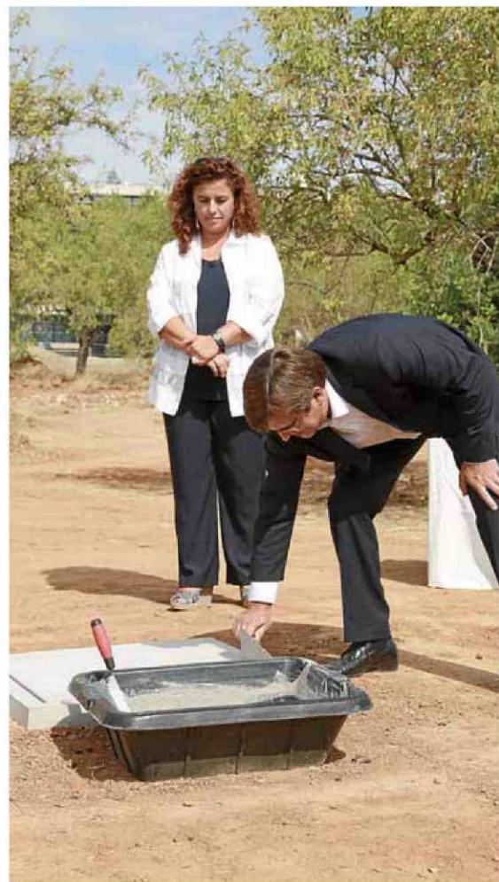
El president Antich, mentre tapava la primera pedra de l'edifici.

Amb tot, Antich també parlà del sector privat, el qual valorà com a "imprescindible" per millorar la competitivitat de l'Arxipèlag i el model productiu. El