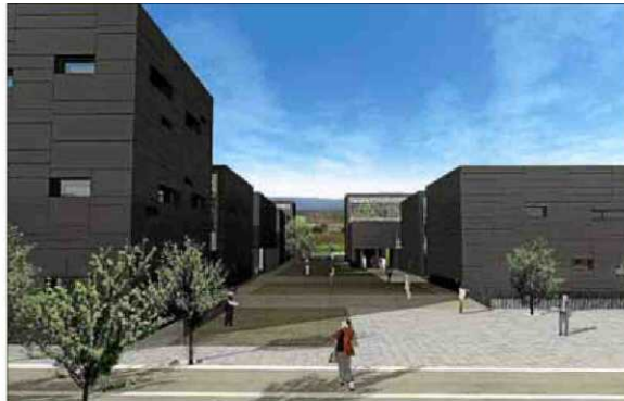
Imagen virtual del futuro Complejo Balear de Investigación.

Este proyecto, enmarcado dentro del Plan de Ciencia, Tecnología e Innovación 2009-2012, no sólo paliará el déficit de infraestructuras científico-tecnológicas en las Islas, sino que será un punto de realización de proyectos de investigación, asesorará a la Administración, fomentará la Ciencia y la Tecnología,