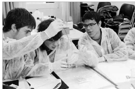
El número de alumnos de Can Salort creció un 14% respecto al curso anterior.

nos en Can Salort, la rectora de la universidad, Montserrat Casas, señaló que Balears sigue todavía muy lejos del 23% de media estatal de alumnos de entre 18 y 24 años que estudian en la universidad. A día de hoy, las Islas se sitúan en el 9,5%, una realidad que para Casas «deja aún un margen muy grande para mejorar». «La valoración de los títulos académicos es menor aquí que en otras zonas del Estado», apuntó la rectora, para quien el incremento de estudiantes en muchas universidades de España