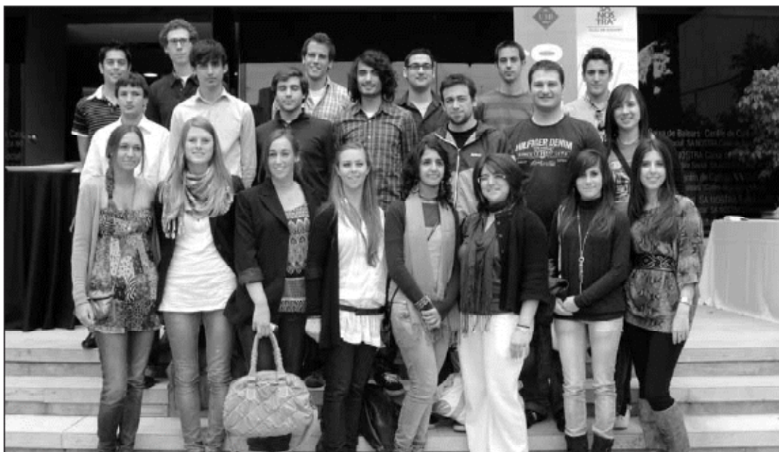
El grup d'alumnes premiats en primer, segon i tercer lloc, juntament amb els guardonats amb premis especials.

234 alumnes, dividits en 66 grups, han participat en la XXI edició del Club d'Inversions "SA NOSTRA"-UIB. El Centre de Cultura "SA NOSTRA" de Palma, ha acollit l'acte de lliurament dels guardons