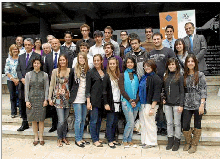
Foto de grupo de los alumnos premiados y los representantes de Sa Nostra y la UIB.