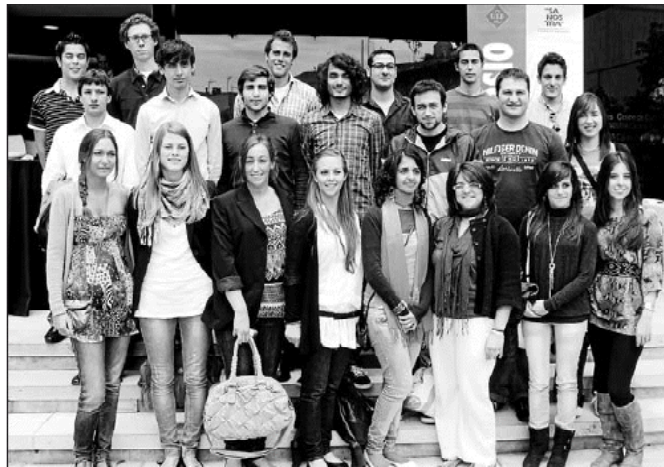
A més dels tres grups premiats, també s'han concedit dos premis especials.