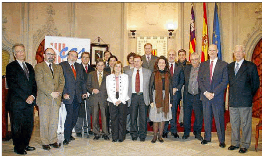
Autoridades, premiados y patrocinadores de la Fundación Kovacs, al finalizar el acto.

Al acto asistieron una amplia representación de la Fundación Kovacs; los consellers de Salut i